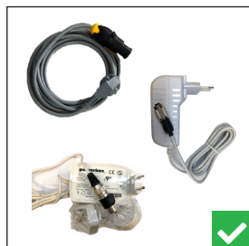
Son chargeur / alimentation externe