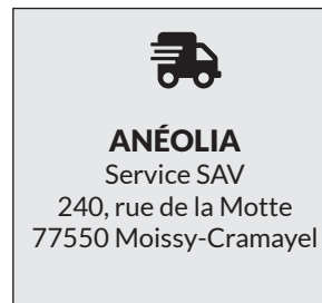
Au service SAV Anéolia