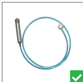
Son kit de prélèvement Oxylos non concerné.